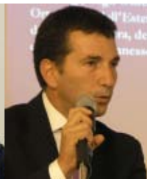
Graziano Di Costanzo Segretario Generale CNA