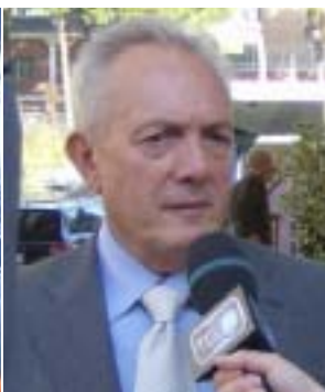
Italo Lupo Presidente CNA Abruzzo